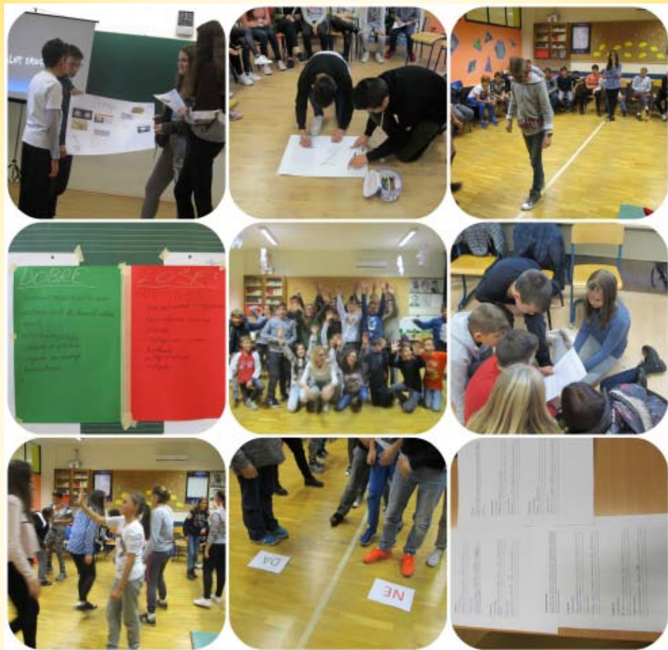
Preventivne radionice u OŠ Brda