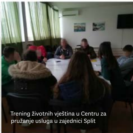
Trening životnih vještina u Centru za pružanje usluga u zajednici Split