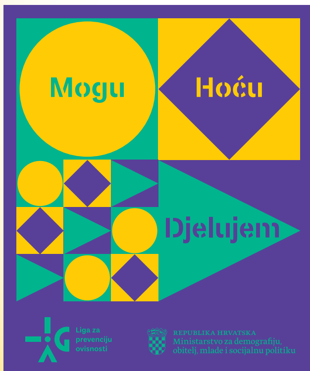
Naljepnica "Mogu, hoću, djelujem"