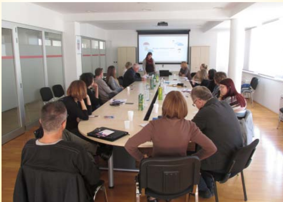
Okrugli stol i predstavljanje brošure Zaštitimo prava djece čiji su roditelji u zatvoru

Projektom se želi unaprijediti sustav zaštite prava djece čiji je jedan roditelj na odsluženju zatvorske kazne. Polazeći prioritarno od najboljeg djetetovog interesa te sumirajući sve izazove i rizike u kojima se nalaze djeca čiji je jedan roditelj na odsluženju zatvorske kazne, procijenili smo da je najbolji način zaštite prava i interesa djeteta ulaganje u roditeljske kompetencije njihovih roditelja, pružanje individualne i obiteljske podrške za oba roditelja u fazi pripreme za izlazak iz zatvora i u post penalnom razdoblju. Uspostavom partnerstva kroz provedbu projekta, uključivanjem novih dionika tijekom provedbe projekta te povezivanjem različitih sustava, pravosudnog i sustava socijalne skrbi, postiže se sinergijski učinak u procjeni stanja i potreba te kreiranju i implementaciji inovativnih i adekvatnih mogućih rješenja za ovu ciljnu skupinu.