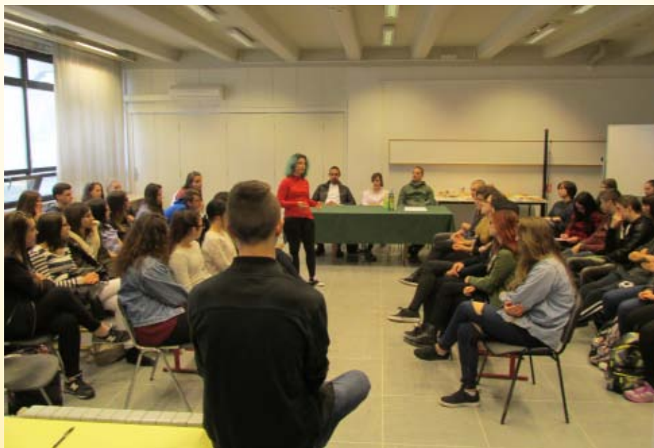
Parlaonica u Školi za dizajn, grafiku i održivu gradnju Split