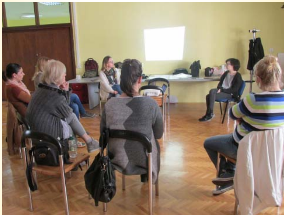
Edukacija Osvještavanje o seksualnosti i rad s mladima - napredni trening