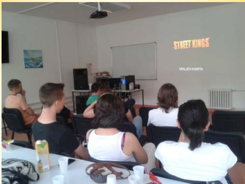
Filmske večeri u Centru za pružanje usluga u zajednici Split